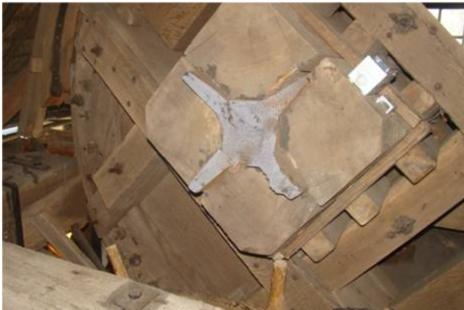
Afgebroken as van de Geestmolen te Alkmaar op januari 2015